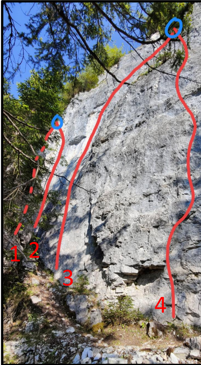
Linker Wandteil (Routen 1&2 hinter Turm)